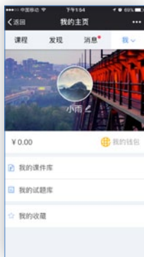
个人主页 修改个人信息 雨课堂钱包入口